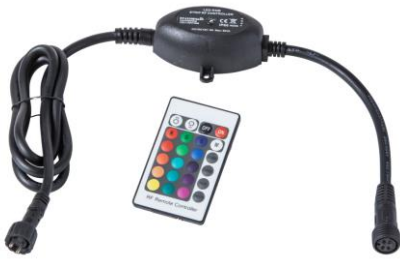
Abbildung links: RGB-Controller L551 mit Funkfernbedienung

ACHTUNG: Betriebsspannung DC 12V. Für den Betrieb ist ein 12V Transformator mit ausreichender Leistung erforderlich. Zur Steuerung des RGB-Lichts muss nun ein RGB Controller 12V mit dem Kabel verbunden werden.