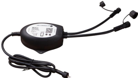
Abbildung rechts: RGB-WiFi Controller L552 mit Steuerung per App

Bei Verwendung im System von HEISSNER SMART LIGHTS verwenden Sie bitte beiliegendes 5m langes Anschlusskabel mit 4poligem SMART LIGHTS Anschlussstecker und verbinden Sie dies mittels den vorinstallierten 2poligen Anschlussklemmen mit dem Kabelende des Wandeinbaustrahlers. Der 4polige Anschlussstecker wird mit dem SMART LIGHTS RGB Controller verbunden.